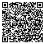
Download on the App Store