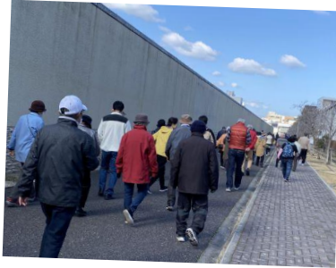
少し寒いですが、好天に恵まれ勢いよくウォーキング開始です