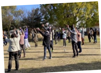
ラジオ体操に合わせて準備運動