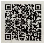
高松市HP掲載ページ

令和6年4月以降のごみ収集カレンダーにつきましては、「広報高松」「市のホームページ」「ごみ分別アプリ」等でご確認いただけますようお願いいたします。