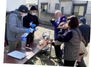
給水ポイントで一息入れもうひと頑張り

日時: 令和6年3月10日(日) 9:30~11:00 場所: 高松刑務所外周(1km)(3km)(5km)コース 参加者: 100名 地区内の新開東公園に集合し、準備体操後、暖かな春の日差しを感じながら、地域の皆さんと刑務所外周のウォーキングを楽しみました。