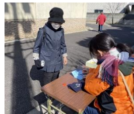
一周ごとにポイントで押印します