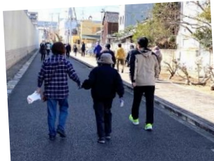
自分のペースに合わせて歩きます